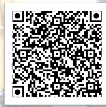
Påmelding og oppdatert program