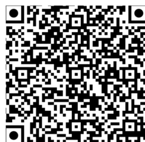
Påmelding og oppdatert program