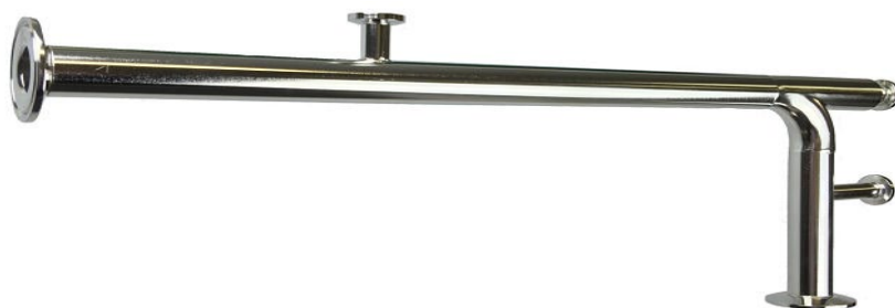
Figur 1 Dampstestbend, Illustrasjon ref. Dekon Solutions